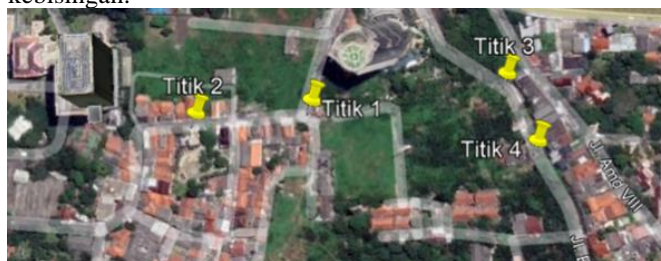
Gambar 2. Titik pengambilan sampling kebisingan

Pengukuran dilakukan dengan interval waktu yang berbeda pada setiap titik sampling. Hasil pengukuran selanjutnya dibandingkan dengan standar baku mutu kualitas kebisingan dalam Kepmen LH Tahun 1996 tentang baku tingkat kebisingan.