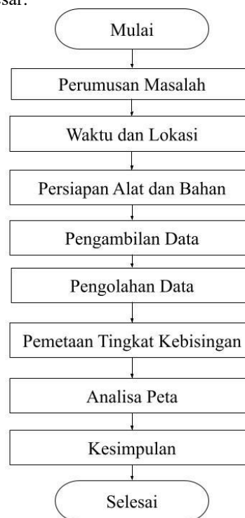
Gambar 1. Diagram Alir Penelitian

Gambar 1. berikut menunjukkan diagram alir penelitian secara garis besar.